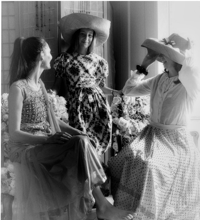
Bereit für den Schlossbesuch