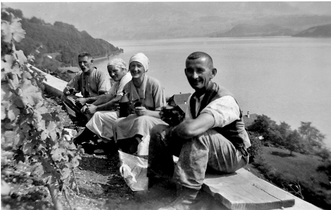
Pause von der Arbeit „i de Müre“. Genossenschafter der ersten Stunde