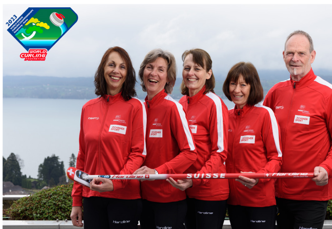
Autogrammkarte des Teams

Die jeweiligen Landesmeister dürfen an den offiziellen Weltmeisterschaften teilnehmen. Diese fanden im April in Gangneung in Korea, in den Stadien der olympischen Winterspiele von 2018 statt. Eine Nacht wollten wir darüber schlafen, ehe wir dem Verband Bescheid geben.