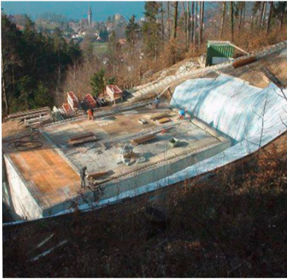
Baugrube und Rohbau Reservoir Winterlücke