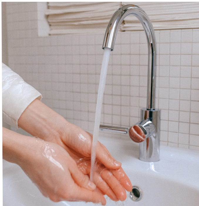
Wasser - unser so kostbares Gut

Aktuell sind die Planungen für den Reservoir-Neubau im Gange und das Genehmigungsprojekt ist schon weit vorgeschritten. Das neue Reservoir soll etwas oberhalb des bestehenden Reservoirs in der Burghalde erstellt werden.