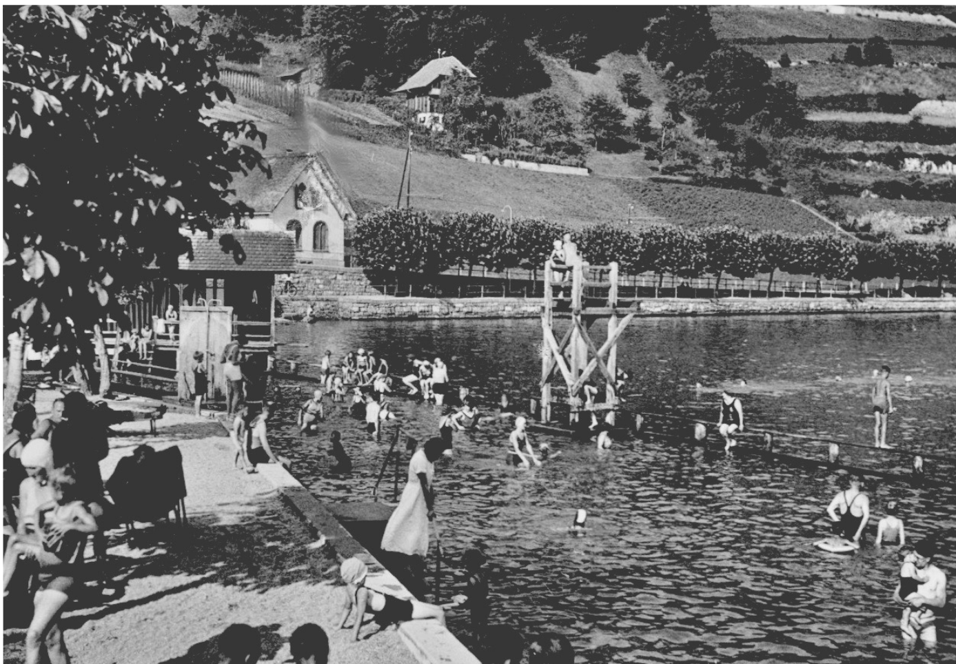
Postkarte vom Strandbad Oberhofen