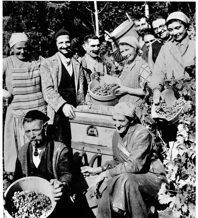
Läset mit „Geute“ und „Bränte“

schaft. So wurde die westliche Hälfte des Rebbergs im Umfang von 10'000 Quadratmetern zum Preis von 1 Franken pro Quadratmeter gekauft. Nun war Land vorhanden, wo aber sollten die Trauben denn gekeltert und gelagert werden? Rasch war klar, dass das Heidenhaus dafür geeignet wäre, nur für den Kauf fehlte das notwendige Kapital. Mit dieser Sorge gelangten die Genossenschafter an die Einwohnergemeinde. Und der Dorfgeist bildete die tragende Kraft.