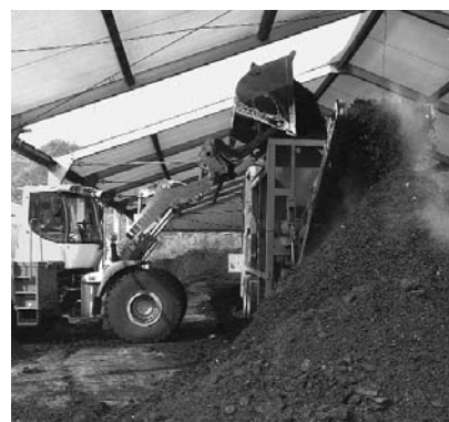
Aufbereitung zu Kompost und Erde

Im Moment ist eine neue Vergärungsanlage der AVAG im Bau, diese wird voraussichtlich im Jahre 2010 den Betrieb aufnehmen können. Erste Priorität wird