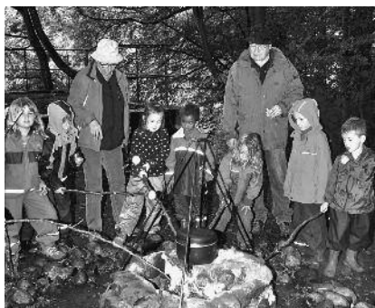
Freiwillige im Waldkindergarten